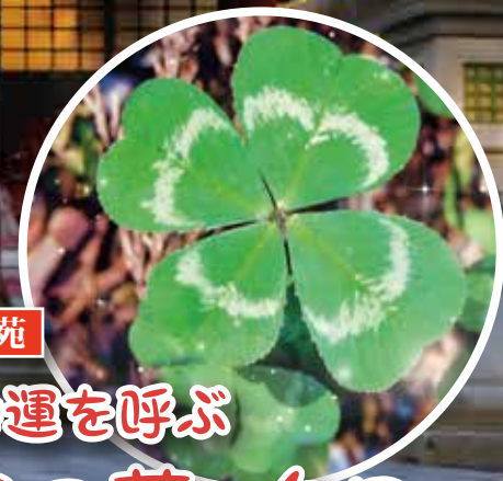
良い縁笹の輪くぐり

笹の輪のくぐり方 初めに左にくぐって回り元の位置に戻り、次に右にくぐって回り、最後に正面に向かってくぐり抜け、御神前でお参り下さい。